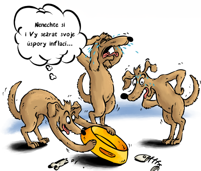
ČÁSTKA NA BĚŽNÉM ÚČTĚ, ČI DOMA 100.000,-

V prvním čtvrtletí roku 2022 se očekává meziroční inflace k 8%, možná až k 10%. Potom ekonomové předpokládají, že by inflace mohla klesat. Pro ochranu financí proti inflaci dnes existuje řada nástrojů. Ať jsou to různé typy dluhopisů, nemovitostní fondy či komodity. Rádi vám v tom poradíme.